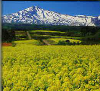
鳥海高原 菜の花畑