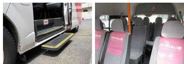
ドア開閉に連動するステップ