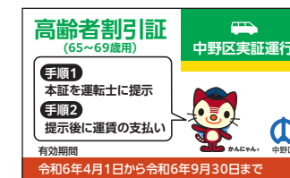
高齢者割引証(見本)