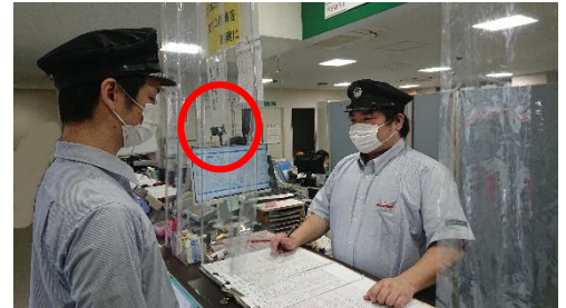
サーモグラフィカメラ